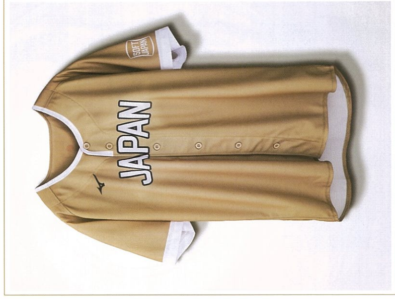
日本代表レプリカユニホーム *サイズはLサイズのみ *画像はイメージです